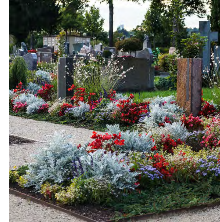
Grabanlage mit Stelen auf dem Totenberg-Friedhof