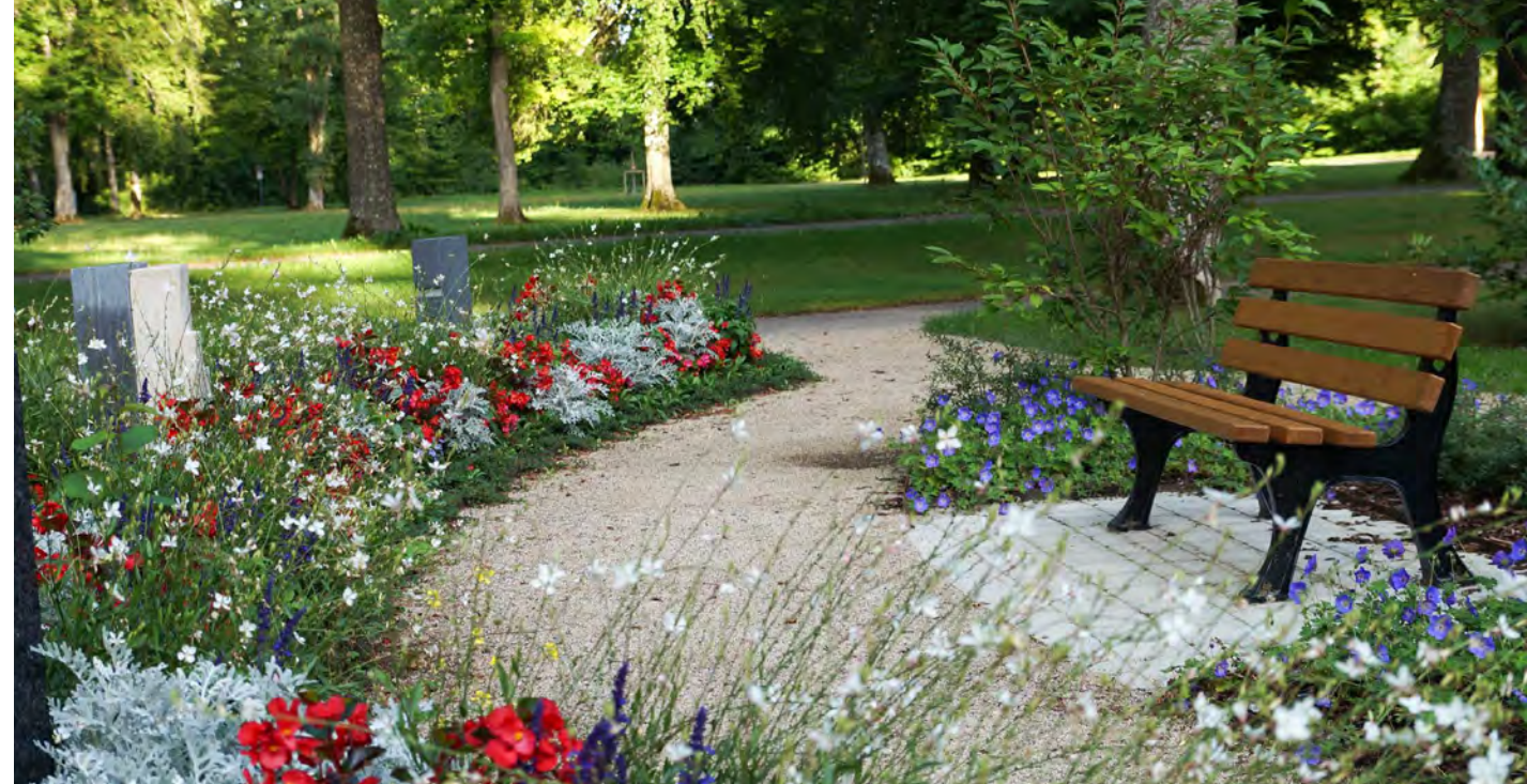
Grabanlage mit Bank zum Verweilen auf dem Waldfriedhof