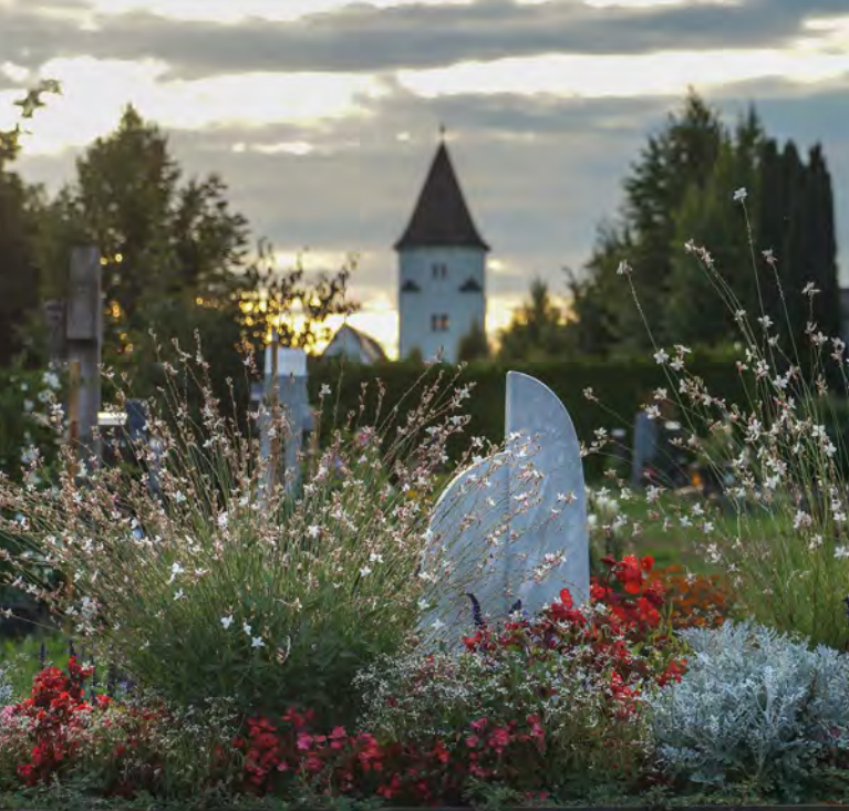
Wechselflor auf dem Totenberg-Friedhof