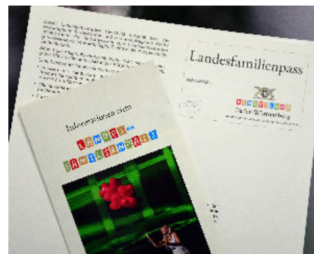
BIU: Landesfamilienpass; Foto: Stadt Heidenheim

auch erhalten, wenn mindestens ein kindergeldberechtigendes Kind in Haushaltsgemeinschaft mit einem Elternteil zusammenlebt, auch wenn die Familie steuerrechtlich nicht mehr als alleinerziehend geltend sollte.