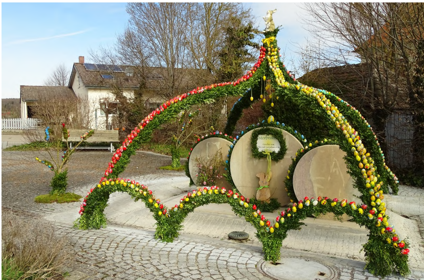
Bild: Osterbrunnen in Großkuchen

Auch dieses Jahr wurde der Brunnen zu einem Osterbrunnen umgestaltet. Der Obst- und Gartenbauverein Großkuchen war wieder fleißig und hat dieses Kunstwerk hergestellt.